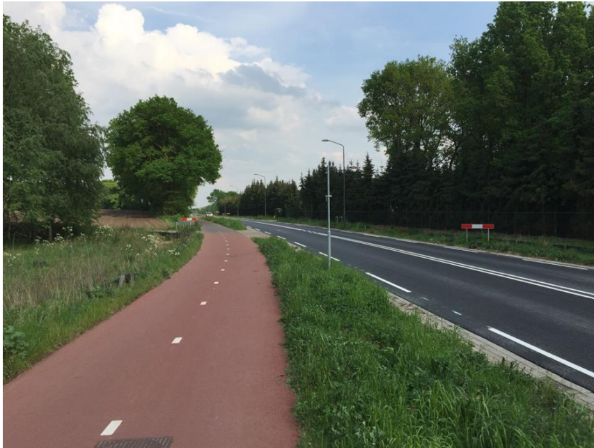
Knoflookpad is opengesteld voor verkeer